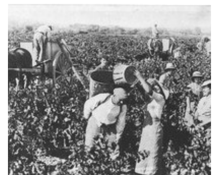
Vendanges autrefois à Moulézan